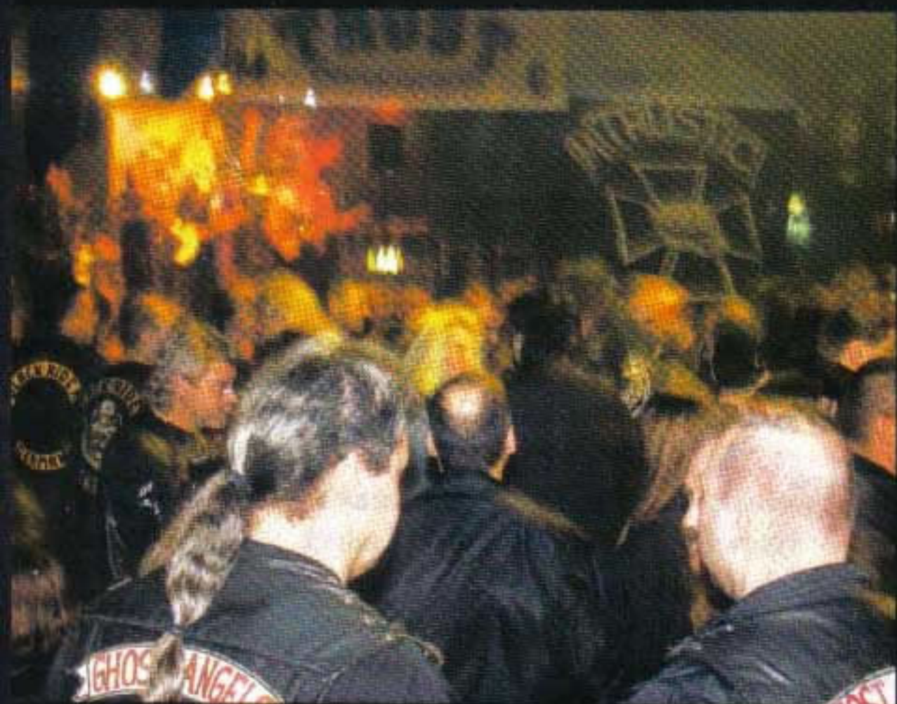
Live-Mucke, Whisky und Bier: Die Party ist in vollem Gange, die Bombe noch nicht geplatzt