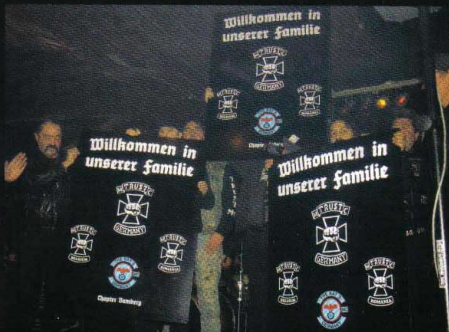
Die ehemaligen Bat's-Präsis mit ihrem Begrüßungsgeschenk