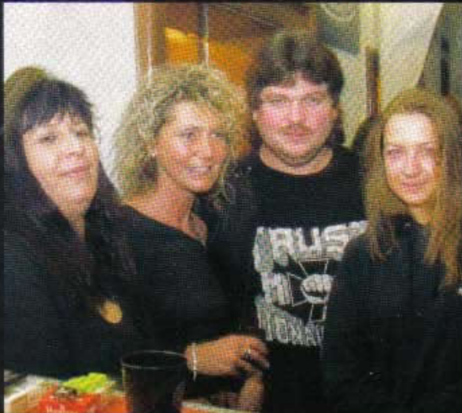
Trust-Chapter-Präsi Gi vom Chapter Donauwörth-Dillingen

Als der Zeiger sich langsam gen Mitternacht bewegt, folgt ein Massendrang zum Tanzsaal. Die Münchner Band hatte die Order, kurz vor