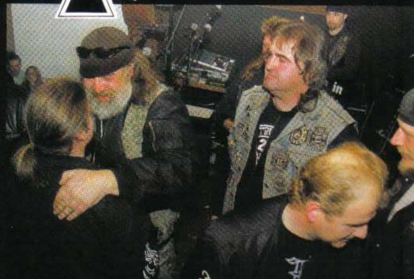
Die Trust-Chefs bei der Begrüßung der neuen Member